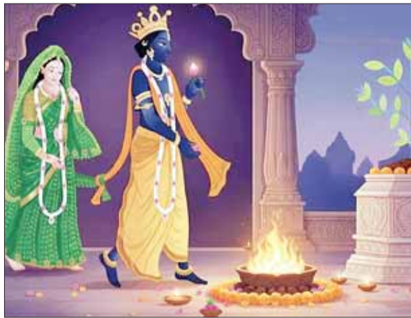
मकरवाहिनी मंदिर में महाआरती

जबलपुर। देवउठनी ग्यारस का पर्व धूमधाम से मनाया गया। इस अवसर पर घर-घर पूजन अर्चन कर मड़ई भरी गई और भगवान शालिग्राम व माता तुलसी का विवाह रचाया गया। गढ़ा और कोतवाली से भगवान शालिग्राम की बारात धूमधाम से निकाली गई। पौराणिक ऐसी मान्यता है कि भगवान विष्णु चार माह क्षीरसागर विश्राम के लिए चले गये थे और कार्तिक एकादशी के दिन ही उठे थे इसीलिए इसे देवउठनी ग्यारस के रूप में मनाया जाता है। इसी प्रकार घर-घर में गन्ने की मड़ई बनाकर भगवान विष्णु और सभी देवताओं की पूजा की गई और गन्ना, भाजी, भटा, आंवला, सिंघाड़ा, शकला, बेर का भोग लगाया गया।